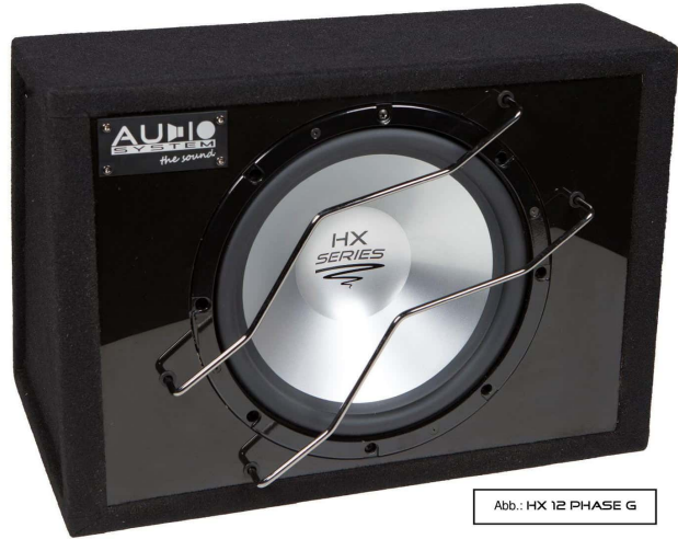
Abb.: HX 12 PHASE G