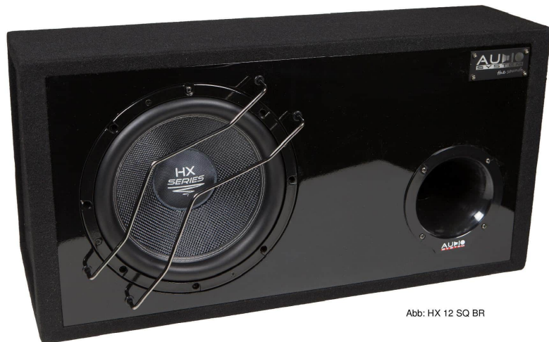
Abb: HX 12 SQ BR