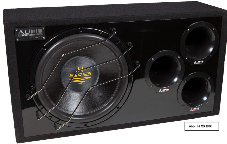
Abb.: H 15 BR